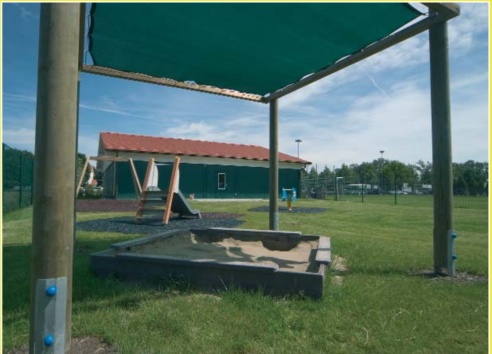
Spielplatz im Garten des ekiz.bie.dorf in der Mühlen-gasse 1. Rechts im Bild der Sportplatz bei der Jubiläumshalle